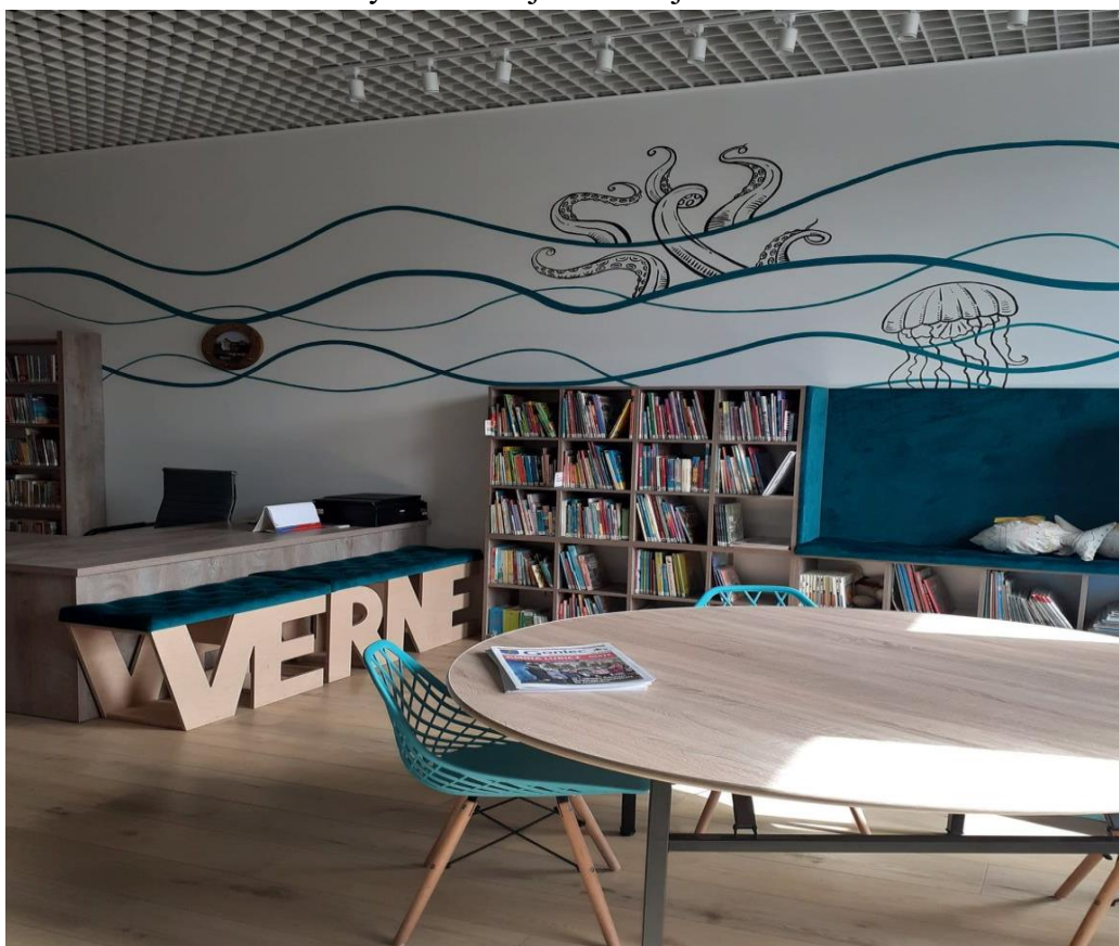
Fot. Filia w Lubiczu Górnym w nowej lokalizacji